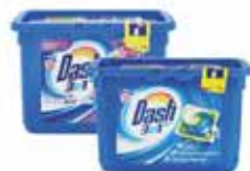
Pods 3 in 1 color/lavanda/regular Dash x 15