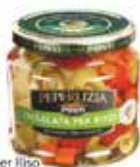
Insalata per Riso Peperizita classica/light Ponti gr. 350