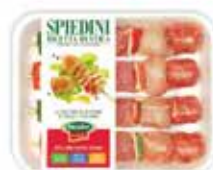
Spiedini Rustici Amadori