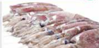
Calamari Sudafrika dec.