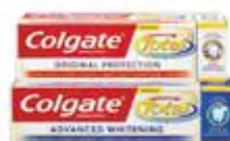
Detrificio Total advanced whitening/ original protection Colgate ml. 75