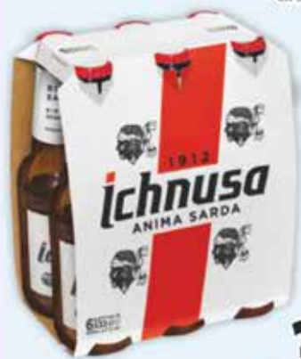
Birra Ichnusa cl. 33 x 6