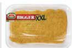
Cotoletta di Tacchino Bigger Aia gr. 280