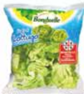
Cuor di Lattuga Bonduelle gr. 150