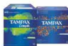
Absorbenti vari tipi Tampax