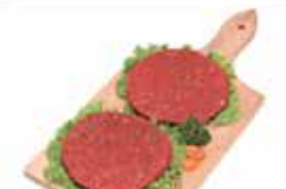
Hamburger di Cavallo