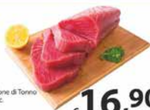
Filetto di Tonno dec.