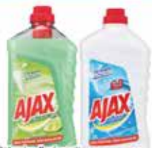
Detensivo Pavimenti varie profumazioni Ajax lt. 1