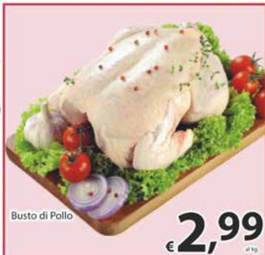
Busto di Pollo