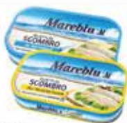
Sgambro olio di oliva/piccante/naturale Marebù gr. 90