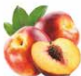
Pesche Nettarine Gialle