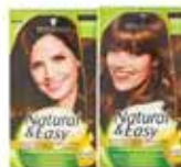
Colorazioni Natural & Easy vari tipi Testaheira