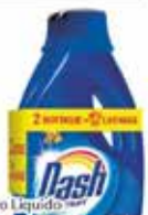
Detensivo Liquido Lavatrice classico Dash 2 x18 misurini