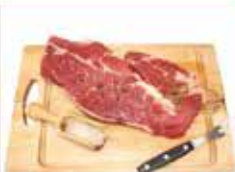
Bistecche di Cavallo