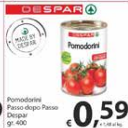
Pomodorini Passo dopo Passo Despar gr. 400